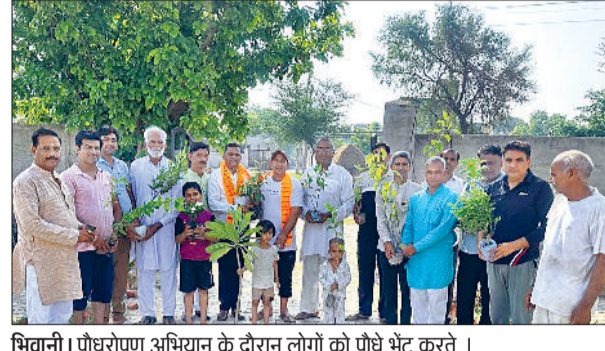
भिवानी। पौधरोपण अभियान के दौरान लोगों को पौधे भेंट करते।